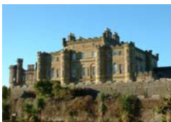
CASTELLO DI CULZEAN

Alle 50 ore di didattica tradizionale si aggiungeranno 20 ore (almeno) di Social English (incluse nel programma):