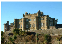
CASTELLO DI CULZEAN

La sesta edizione di “English runs in Europe” si svolgerà presso la Saint Andrews University (nei pressi di Edimburgo), la più antica ed importante università scozzese, tra le più note e prestigiose di tutto il Regno Unito (nota anche perché vi ha condotto gli studi universitari il principe William), ove si terranno corsi intensivi di lingua inglese, nell’arco di due settimane (dall’8 agosto al 22 agosto 2010) .